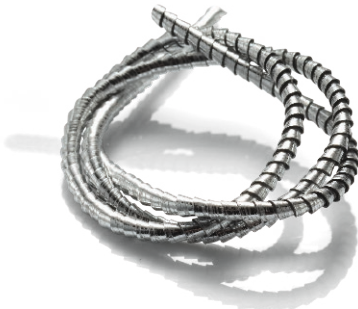
Spanbildung mit herkömmlicher Bearbeitung