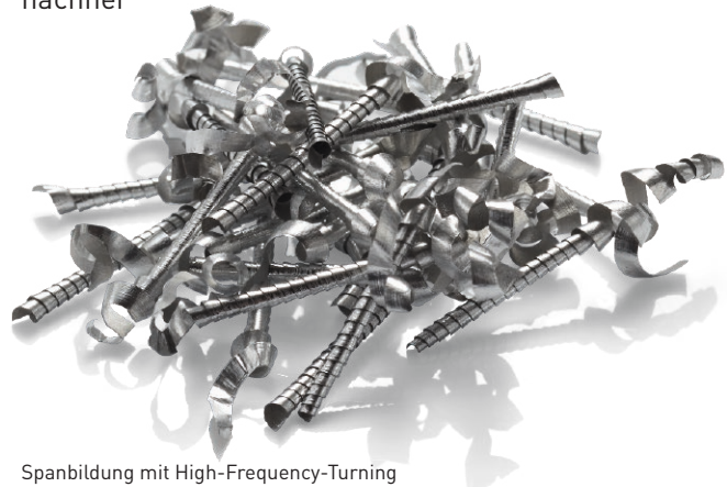
Spanbildung mit High-Frequency-Turning

Weitere Informationen unter: http://hft.starmicronics.eu/